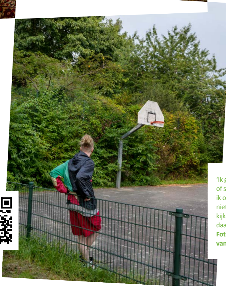
'Ik ga vaak naar een sport- of skatepark, ondanks dat ik om medische redenen niet kan sporten. Niemand kijkt raar op wanneer ik daar de hele dag ben.'