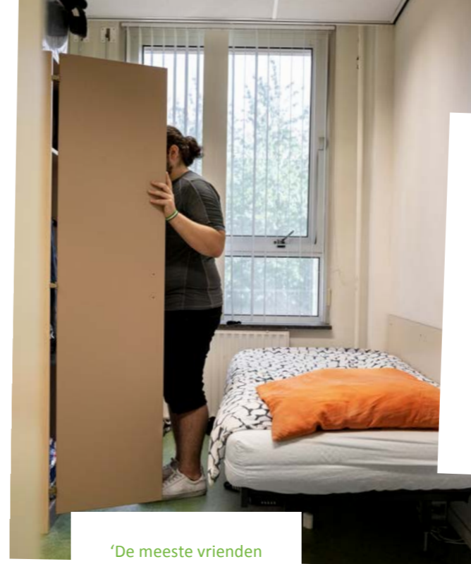
'De meeste vrienden weten niet eens dat ik dakloos ben. Ik neem ze nooit mee naar de opvang'