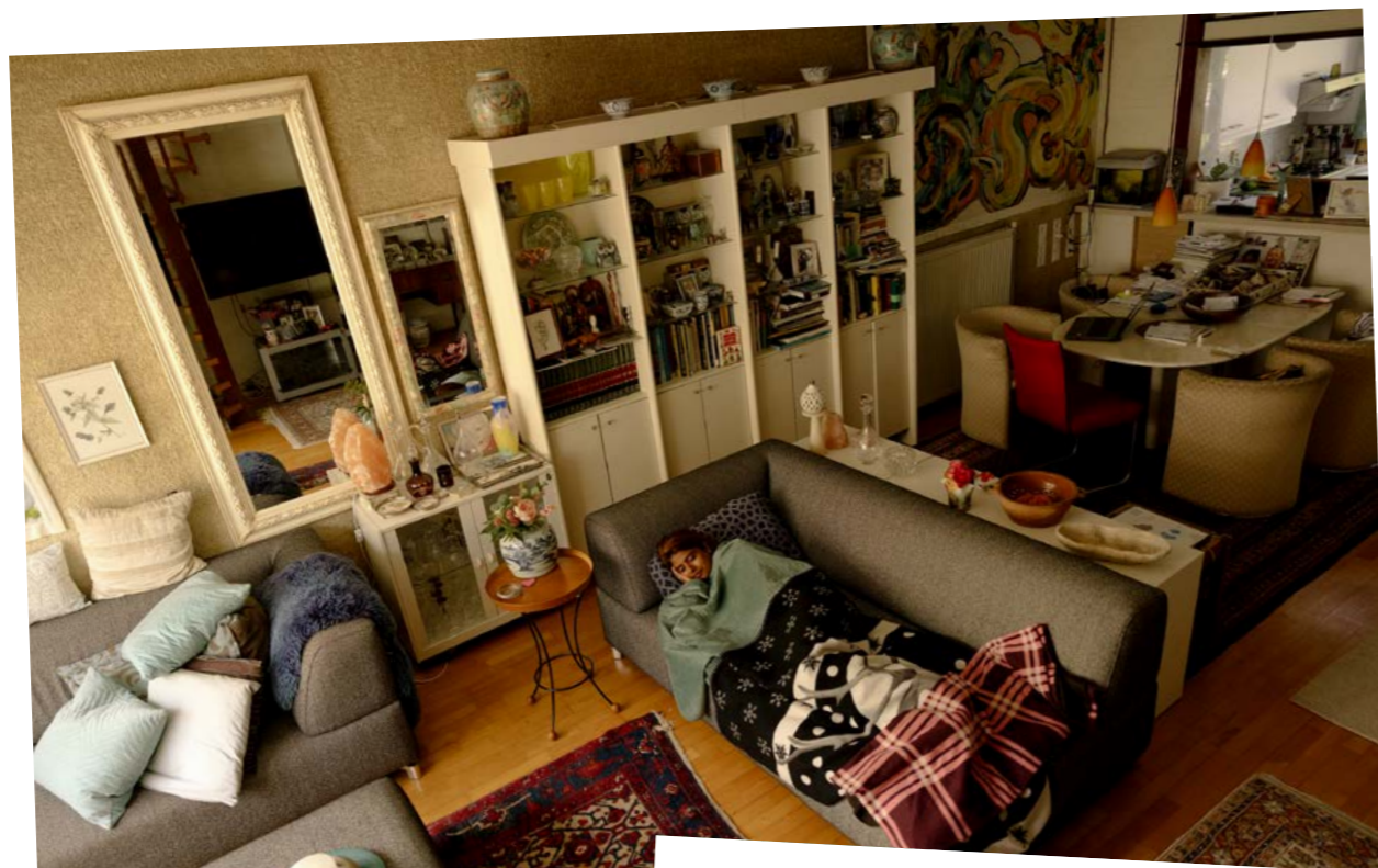
Halima is dakloos sinds ze bij haar man weg is, die haar psychisch mishandelde. Hier poseert ze op de bank waar ze al vele malen sliep, in de woonkamer van een vriendin.

Fotograaf Dingena Mol maakte dit jaar voor Het Beelddepot een eigentijdse versie van haar veelgebruikte foto van een dakloze man van middelbare leeftijd op een bankje in een park. Het nieuwe beeld, geschoten op precies datzelfde bankje, toont een jonge vrouw die op haar telefoon kijkt. Naast haar staan, in plaats van een blikje bier, een rolkoffertje en een flesje water.